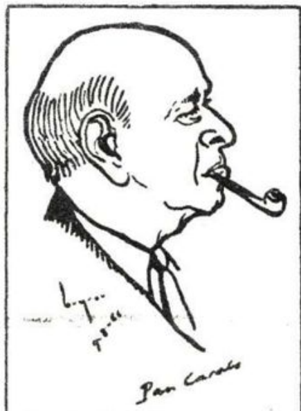
Pau Casals 1966.