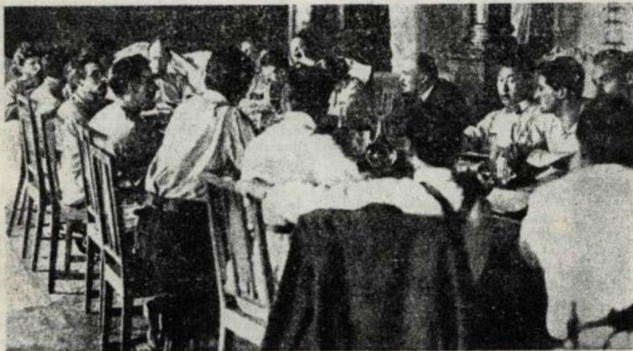
Lenin a una reunió de la III Internacional. 1920